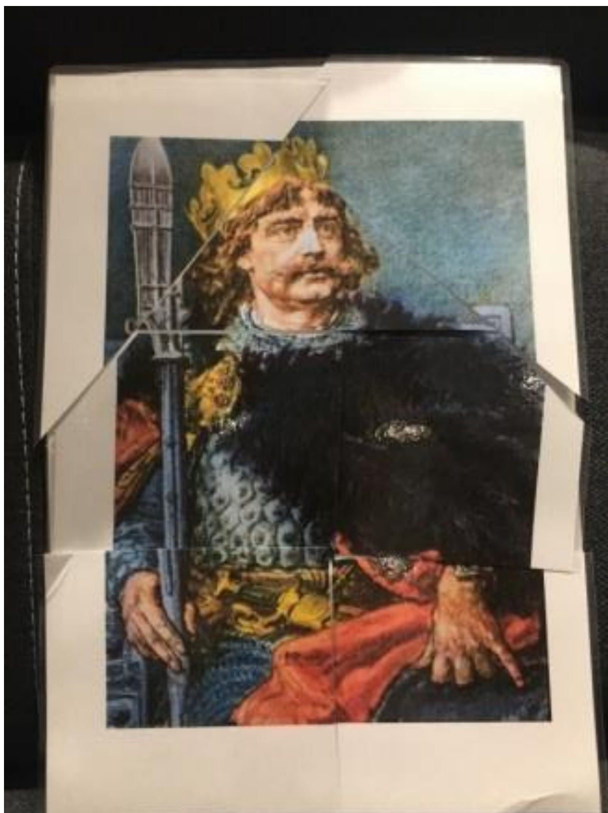
Załącznik nr 1