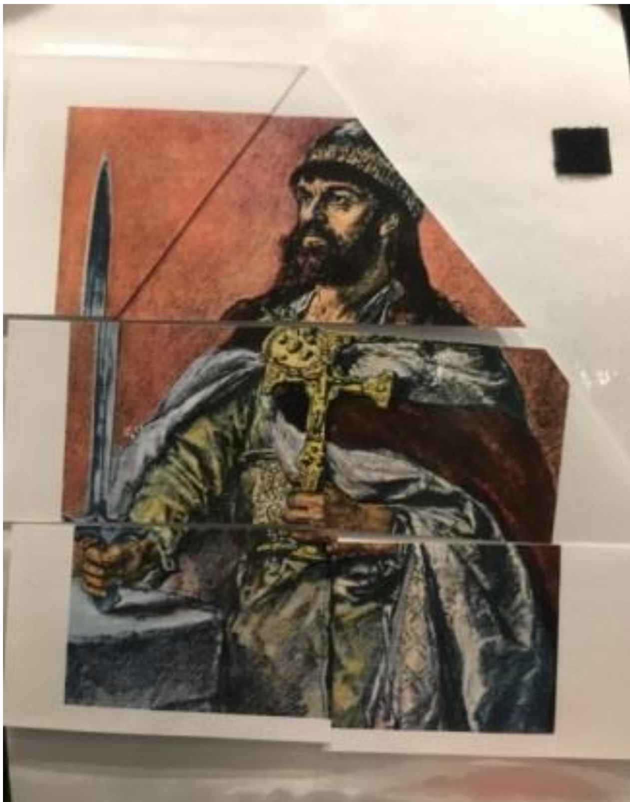
Załącznik nr 2