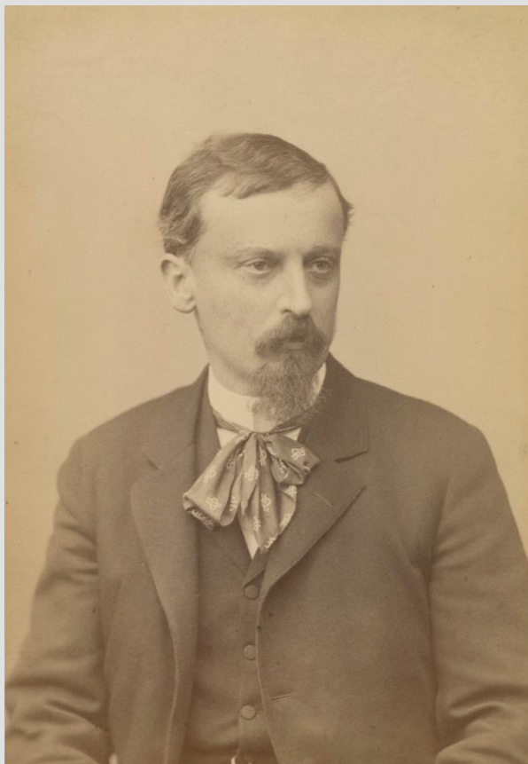
Portret Henryka Sienkiewicza (1846-1916)