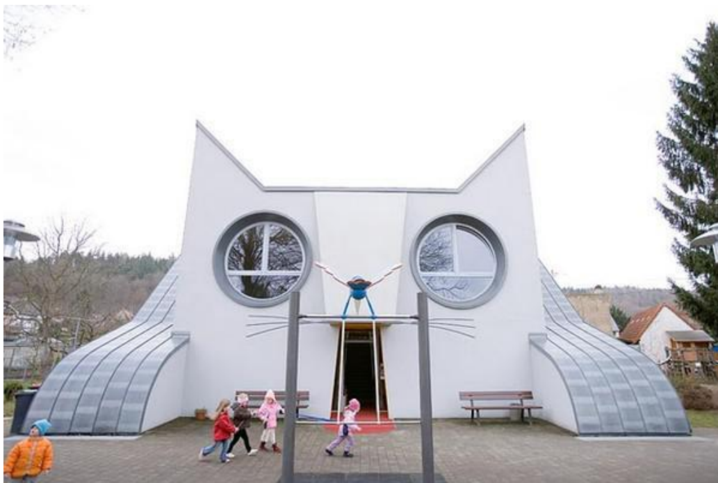
Jedno z przedszkoli w Niemczech.