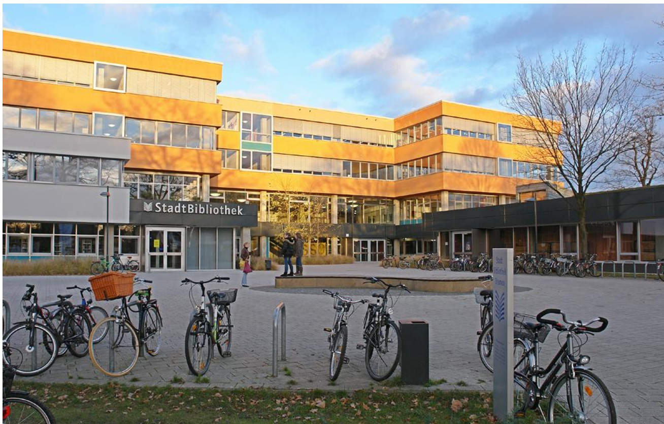
Niemiecka Szkoła ogólna w Niemczech (Bremen)