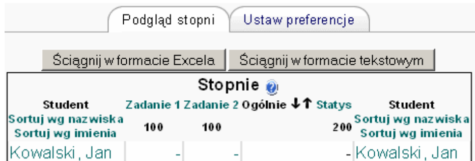
Rysunek 1: Arkusz ocen, tryb podstawowy

Menu oceny zawiera arkusz ocen (punktów zdobytych przez studentów) i w swojej najprostszej postaci wygląda mniej więcej tak: