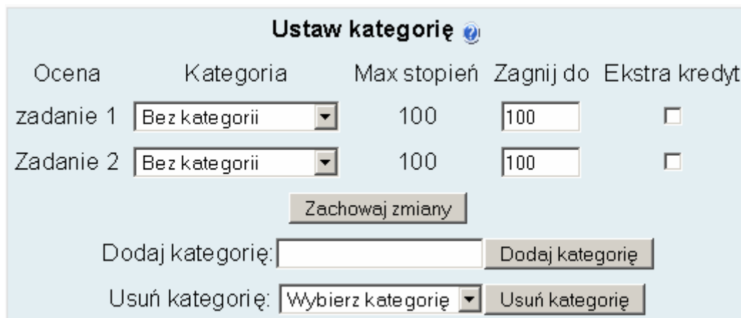
Rysunek 5: Tworzenie nowej kategorii ocen

Zakładka „kategorie” (będzie dostępna dopiero po przełączeniu arkusza ocen w tryb zaawansowany) zawiera menu ustawień kategorii oceniania zawiera (rys. 5):